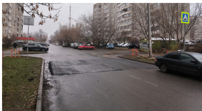
Искусственная дорожная неровность в районе дома 56 по ул. Мясницкая