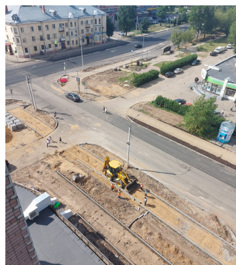
Работы по реконструкции перекрестка ул. Ивана Сусанина и ул. Свердлова