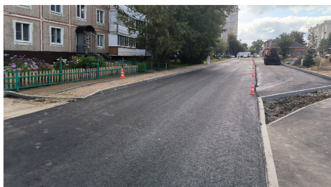
Обустройство дороги-дублера улицы Ивана Сусанина